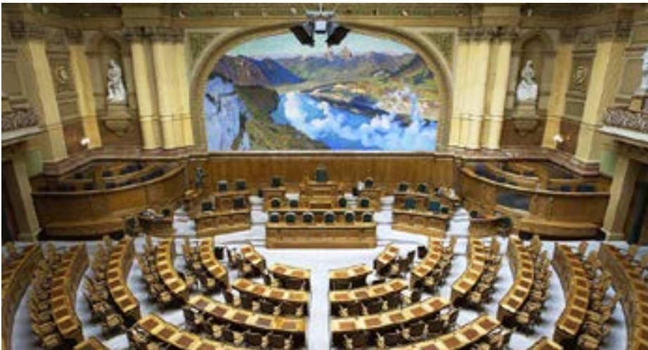
Nationalratsratssaal : Schweiz plenisal för sin "riksdag"

Jämförelsen mellan Sverige och Schweiz faller på nära nog alla områden ut till Sveriges nackdel – trots Sveriges större naturtillgångar. Det måste således vara något i politiken som felar eller snarare i det konstitutionella ramverket för politiskt beslutsfattande.