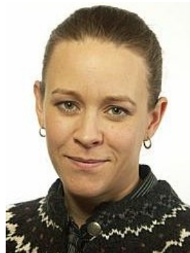
Maria Wetterstrand (MP)

I skenet av klimatförändringarna har behovet av ett stärkt strandskydd också blivit större. Bebyggelse i strandnära lägen kan på sikt riskera att svämmas över i takt med stigande vattenstånd.