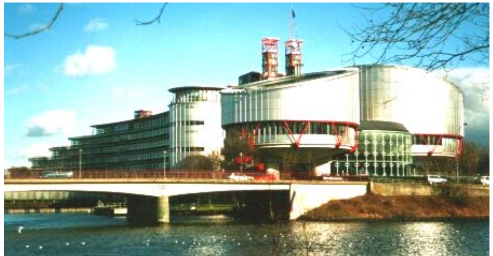
Europadomstolen för mänskliga rättigheter i Strasbourg

I detta temanummer framförs olika ståndpunkter. Här diskuteras också vad Medborgarrättsrörelsen kan göra för att stärka opinionen för rättigheter. Det gäller framför allt hur rättigheterna fungerar, och inte fungerar, i praktiken.