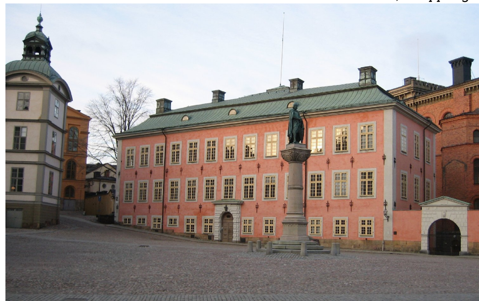
Domstolarna och kommunerna får egna kapitel i Grundlagsutredningens förslag. Här syns Regeringsrätten, som håller till i Stenbockska palatset på Riddarholmen i Stockholm.